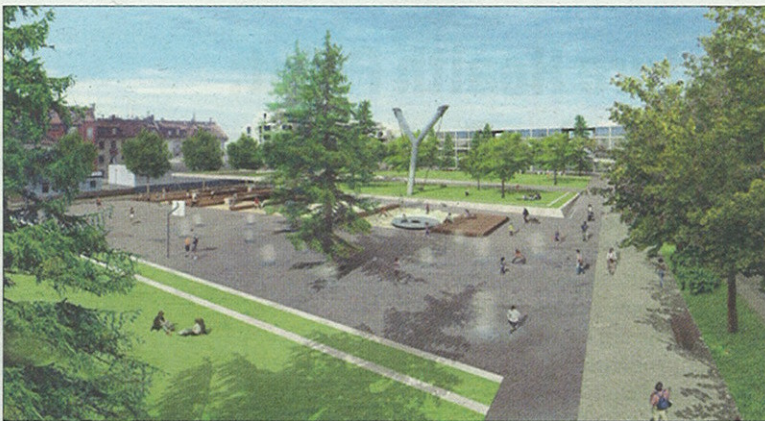
Der geplante Hardaupark mit einer «Schleuder» als Schaukel.

Soweit die Ausgangslage. Umstritten ist nicht der Park, sondern – ein-