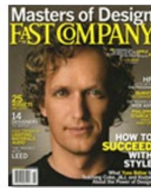
Fast Company October 2007