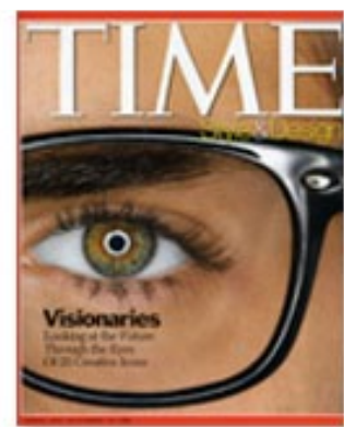
Time October 2007