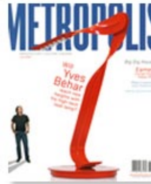
Metropolis June 2006