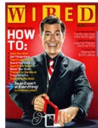
Wired August 2006