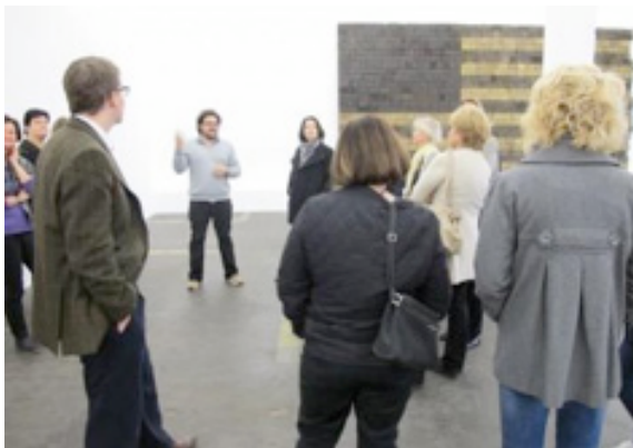
Abbildung 2: Website Kunsthalle St. Gallen, aufgerufen: 04/2012.