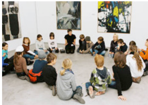
Abbildung 3: Website Kunstmuseum Chur, aufgerufen: 04/2012.

Kunstvermittler_innen darin selten zu sehen gegeben werden und der Fokus stattdessen auf der Darstellung des Publikums liegt. Nichtsdestotrotz übernehmen die unterschiedlichen Darstellungsweisen von Vermittler_innen sowie deren spezifische Un-/Sichtbarkeit in den Repräsentationen von Kunstvermittlung eine wichtige Funktion, wenn es um die Produktion von Bedeutung und die Konstruktion von Subjekten geht (vgl. Fürstenberg 2012).