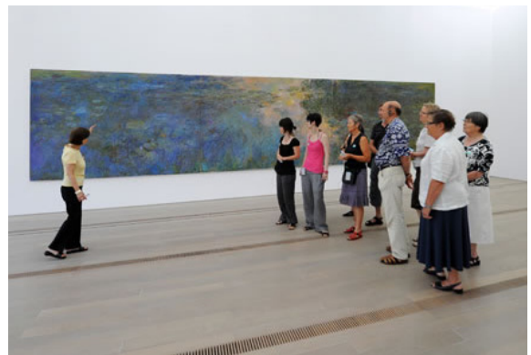
Abbildung 1: «Öffentliche Führungen», Website Fondation Beyeler, aufgerufen: 04/2012.

Die oft unreflektierten Praktiken der Wiederholung in Form von Repräsentationsmustern wurden im Kontext des Forschungsprojektes Kunstvermittlung zeigen 1 eingehender untersucht und werden für diesen Artikel auf die Figuren Kunstvermittler_in 2 und Publikum hin fokussiert. Es wird der Frage nachgegangen, welches