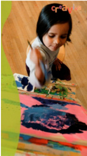
Abbildung 6: Flyer «Junge Kunst im Zentrum» (Detail), Zentrum Paul Klee, o.J.

Zugleich kann jedoch die Figur Vermittler_in nur auf konventionelle Art und Weise gezeigt werden, wie unter Einbezug der hier nicht vollständig ausgeführten Analysen zu Repräsentationsmustern geschlussfolgert werden kann. Es sind die sich historisch herausgebildeten und miteinander verschränkten Praktiken eines Teaching-Caring-Representing bzw. Unterweisen-Zuwenden-Repräsentieren (vgl. auch Dalton 2001), die wiederholt zu sehen gegeben werden. Eine Rolle bzw. Aufgabe, in der sich seitens der Vermittler_innen Autorität, Kennerschaft, Könnerschaft sowie Unterstützung, Fürsorge, Einfühlung mit der Darstellung und Stellvertretung der Institution Museum verschränken. Das an unterschiedlichen Stellen wiederholte Bild dieses ideal subject – komplementär zum Entwurf eines wissenden, jedoch zu bildenden Publikums – kann als «Repräsentationsregime» 17 bezeichnet werden, welches eine ungleiche Beziehung zwischen Vermittler_innen und Publikum festschreibt und eine implizite Hierarchisierung reproduziert.