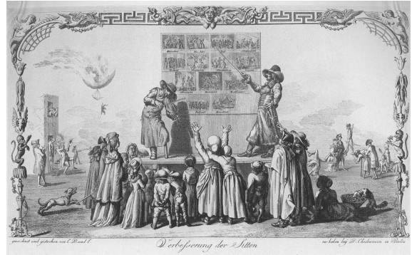
Abbildung 5: «Verbesserung der Sitten» (1786) von Daniel N. Chodowiecki, online unter: http://commons.wikimedia.org , abgerufen: 07/2013.

«Der abstrakte Zeigegestus ist in der christlichen Ikonographie als Lehrgestus bekannt [...] Dass die einst klassische Lehrgeste so selten geworden ist, muss mit einer veränderten pädagogischen Einstellung zusammenhängen, in der ein Lehrer [!] nicht mehr Autorität besitzt, auf eine abstrakte Lehre zu verweisen, ohne sie gleichzeitig in Frage zu stellen; es wird nicht mehr von der Existenz einer bestimmten