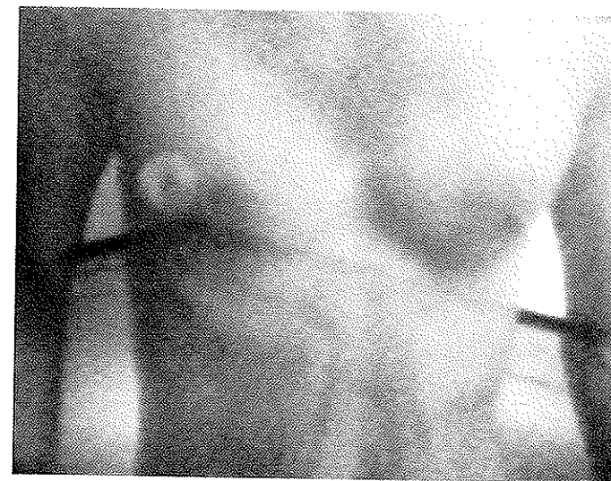
Schirmbild, 1980, Arbeitsfoto aus: Das Lied der Heimat, 1977/80

1973: Unikate-Originalbücher von 20 Künstlern, Galerie Stähli, Zürich; 1974: Transformer-Aspekte der Travestie, Kunstmuseum, Luzern (Kat.). 1975: Transformer-Aspekte der Travestie, Bochum (Kat.); Biennale des Jeunes, Paris (Kat.); Selbstportrait als Selbstdarstellung, Taxispalais, Innsbruck; Körpersprache, Haus am Waldsee, Berlin (Kat.). 1976: 2ème Biennale de l'Image Multipliée, Musée Rath, Genève (Kat.). 1977: 20 artistas juvenes suizos, Bogotá und Medellín (Kat.); La Boutique Aberrante, Centre Georges Pompidou, Paris (Kat.); Premières Rencontres Internationales d'Art Contemporain, Montréal/Canada, National Gallery Toronto/Canada (Kat.); Zeichnungsausstellung, Galerie Stampa, Basel. 1978: Le dessin en Suisse, la nouvelle génération (Première quadriennale de dessin), Musée Rath, Genève (Kat.). 1979: Sixth British International Print Biennale, Bradford (Kat.); Salon presents, Museum Folkwang, Essen (Kat.). 1979/80: Kunst als Photographie, Photographie als Kunst, Innsbruck, Linz, Graz, Wien (Kat.); Kunstbücher, Galerie Lydia Megert, Bern. 1980: Kunstmacher 80, Museum zu Allerheiligen, Schaffhausen (Kat.); Werke junger Basler, Kunstmuseum, Basel.