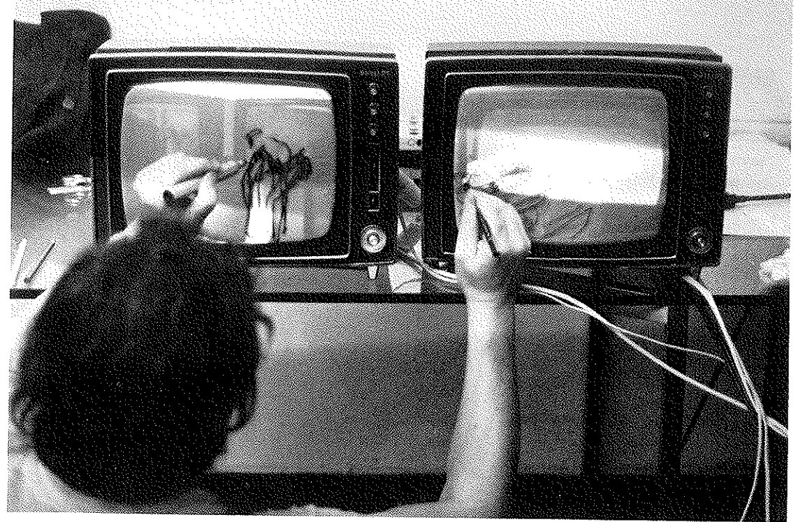
A. 'Je ne peux pas dessiner ma main tentant de se dessiner' Galleria dell'Obelisco, Rome, juillet 1971 (de la série des 'T.V. Drawings' commencée en 1964)

Ausführliche Ausstellungsliste und Bibliographie in: Ausstellungskatalog Veith Turske, Köln 1980.