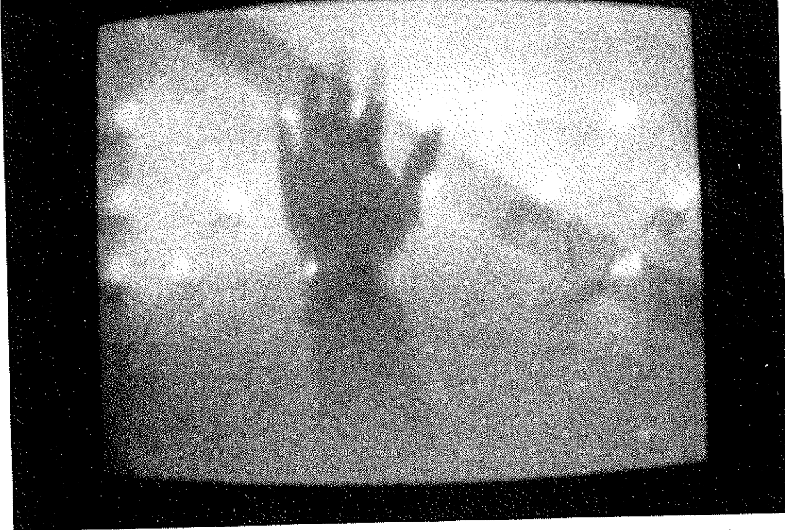
C. VIDEO (=Je vois) traduit selon l'alphabet Braille pour les aveugles avec 14 points collés sur l'écran (1972) ou 14 flammes de bougies lues à la main. Art Tapes 22, Florence, 1975. Coll. Archives de la Biennale de Venise et Musée Des Beaux-Arts, Lausanne.