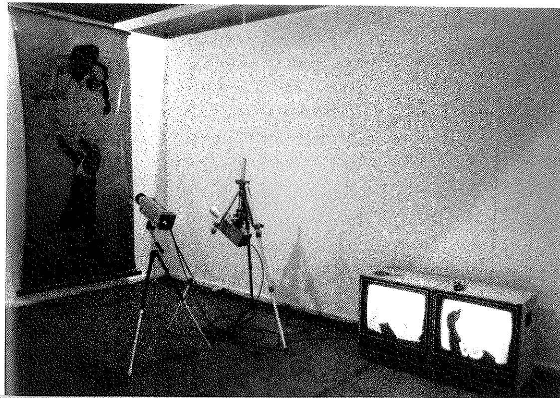
F. 'Un Beau Couple'. Installation videopalindromique en apesanteur. Videomixmedia, Art'II, 1980, Bâle, Musée Rath, Genève, 1981 (Double circuit video, photographie, couteau, revolver).