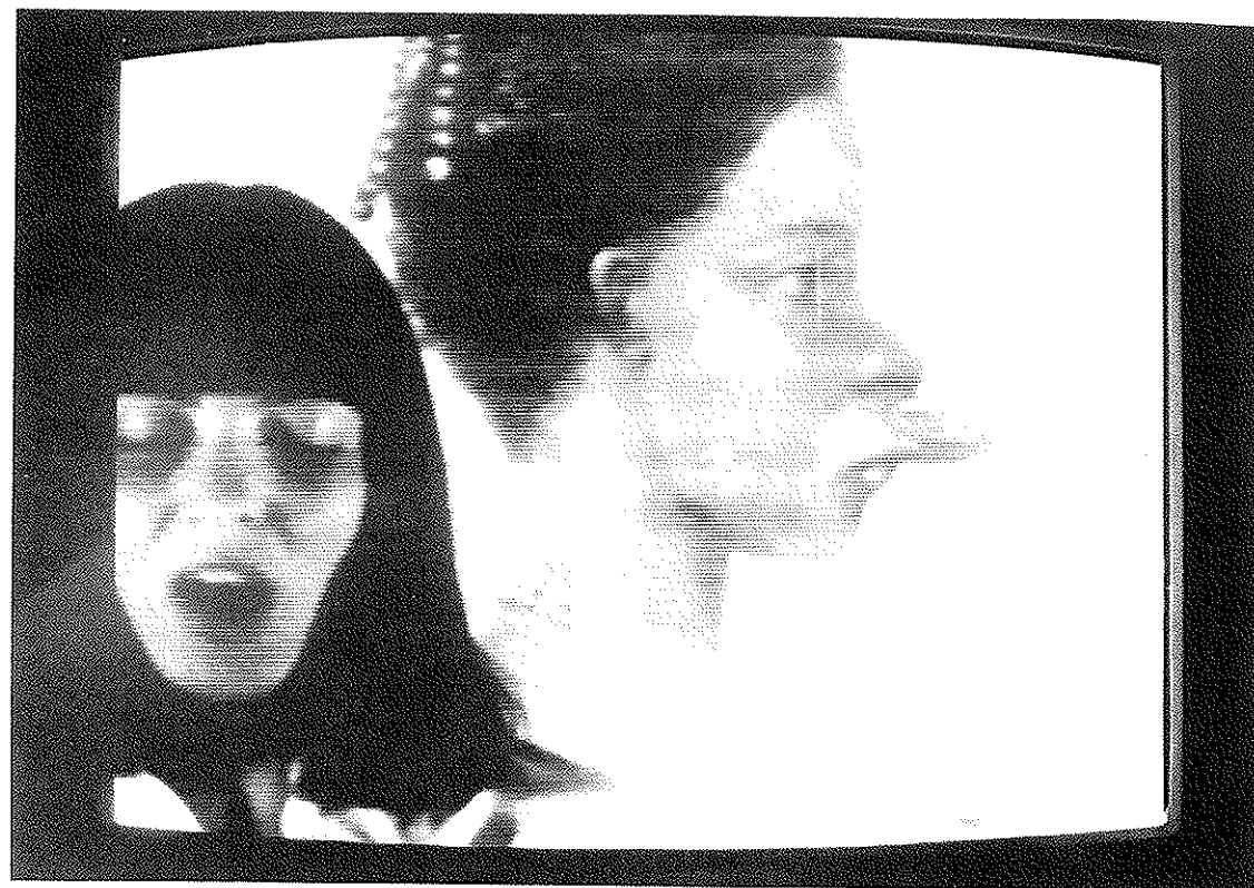
«POUR MOI, VOLS ÊTES AUSSI EXOTIQUE», VIDEO 79